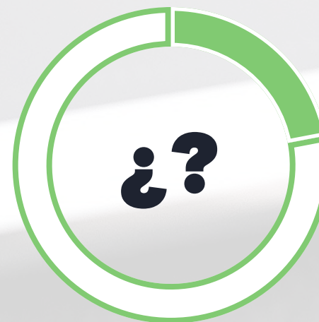
Aún no sabe